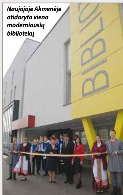
Naujojoje Akmenėje atidaryta viena moderniausių bibliotekų

• Vidaus reikalų ministerijoje vyko Merų forumas, kuriame diskutuota apie tiesioginius merų rinkimus, jų privalumus ir trūkumus, savivaldybių veiklą.