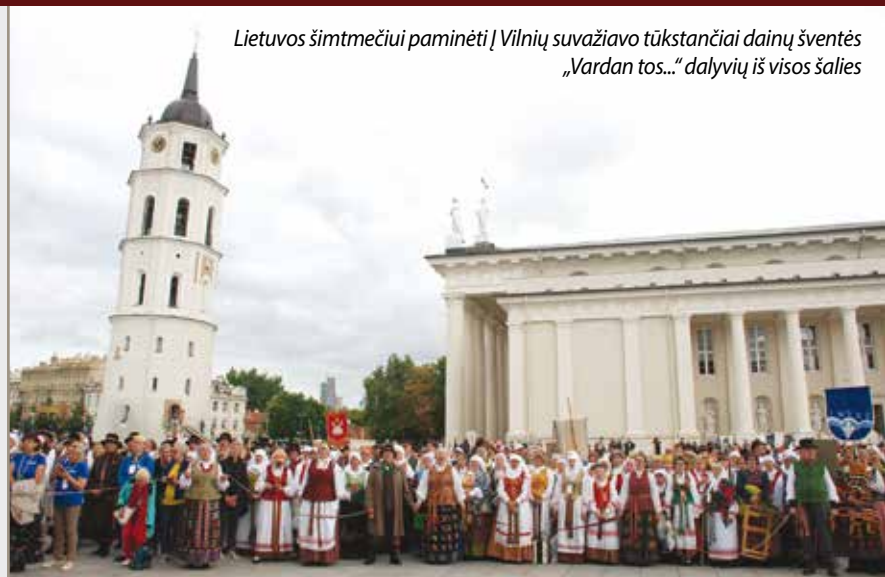
Lietuvos šimtmečiui paminėti | Vilnių suvažiavo tūkstančiai dainų šventės „Vardan tos...“ dalyvių iš visos šalies

• Anykščių kultūros centras po dešimties metų trukusio pastato atnaujinimo pagaliau