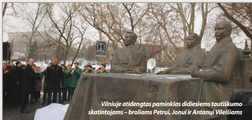
Vilniuje atidengtas paminklas didiesiems tautiškumo skatintojams – broliams Petriui, Jonui ir Antanui Vileišiams