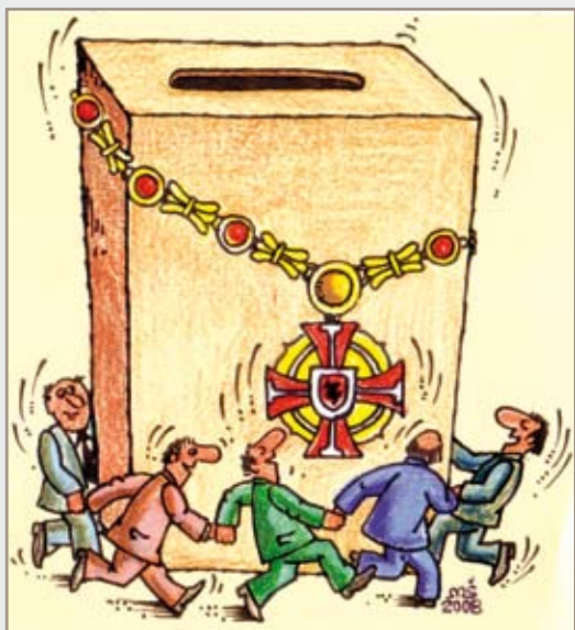
Mečislavo Ščepavičiaus pieš.

Gal naujosios savivaldybių taryboms nereikėtų laukti nei protestų, nei dienos, kada nacionalinius debatus inicijuos, tarkime, Lietuvos prezidentas, kurį išrinktume gegužę. Sakyti, kad kiekvienas tarybos posėdis yra tokie debatai. Bet ar jį būna vaisingi, jeigu apsamojant piliečių mentalitetą lieka nepajudintas?