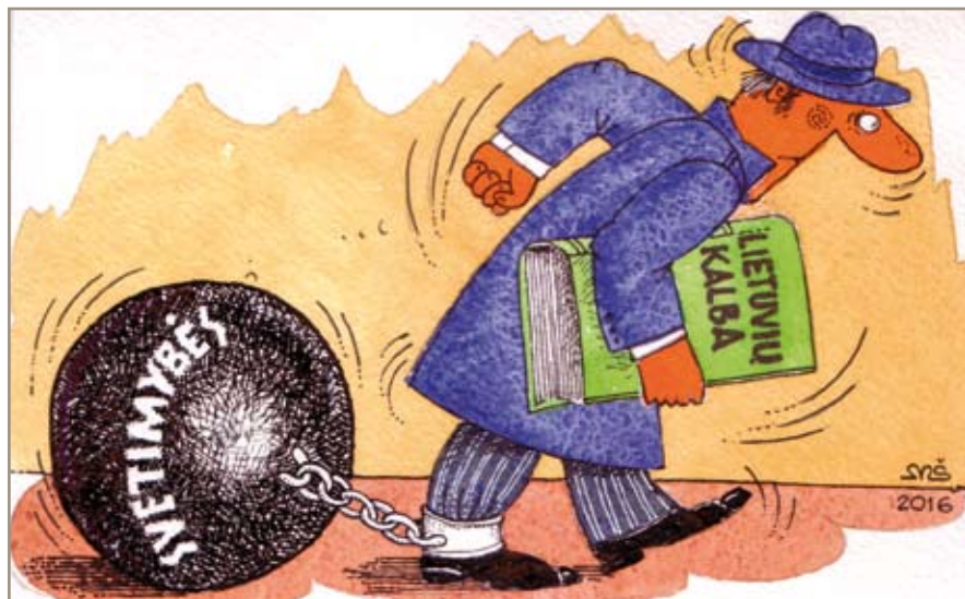
Mečišlovo Ščepavičiaus pieš.

Ryžtingas VLKK žingsnis panaikinti kalbos klaidų sąrašą kaip teisės aktą veda visuomenės pasitikėjimo, pagarbos link, o ne atvirkščiai.