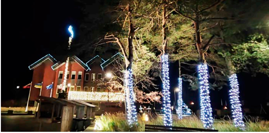
Neringos savivaldybės aikštė jau laukia Kalėdų.