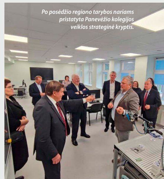
Po posėdžio regiono tarybos nariams pristatyta Panevėžio kolegijos veiklos strateginė kryptis.

Atliekų tvarkymo paslaugų srityje numatoma įgyvendinti kelis reikšmingus projektus, kuriuos vykdys Regioninis atliekų tvarkymo centras, bendradarbiaudamas su visomis Panevėžio regiono savivaldybėmis. Planuojama įrengti ir plėsti didžiagabaričių atliekų aikšteles, sukurti punktus perdirbimui tinkamų atliekų surinkimui bei įrengti konteinerių aikšteles arba išdalinti konteinerius gyventojams. Taip pat bus vykdoma plati komunikacinė kampanija, siekiant skatinti tinkamą atliekų tvarkymą ir rūšiavimą.