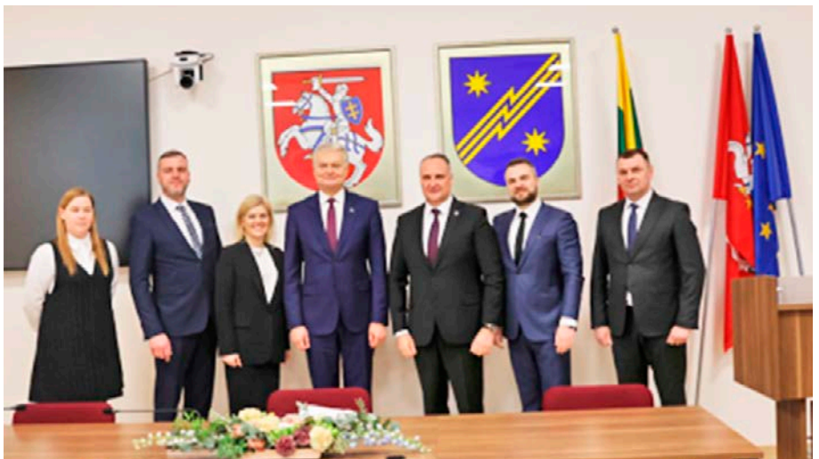
„Ne girtis, o spręsti problemų susitikome su Respublikos Prezidentu“, – sako meras ir jo komanda.