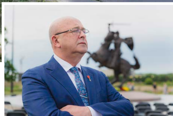
Visvaldas MATIJOŠAITIS Kauno miesto savivaldybės meras