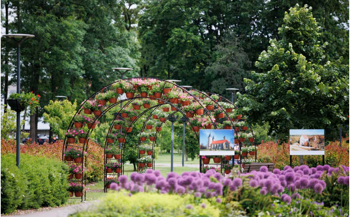
Seniau buvusį pilką betoninį taką pakeitė naujas. Ši žalia erdvė – vienas iš miesto traukos objektų, kuris užtikrina harmoniją tarp urbanistinės ir gamtinės aplinkos.