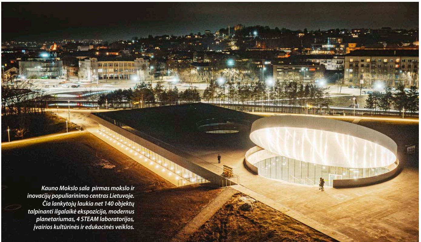
Kauno Mokslo sala pirmas mokslo ir inovacijų populiarinimo centras Lietuvoje. Čia lankytojų laukia net 140 objektų talpinanti ilgalaikė ekspozicija, modernus planetariumas, 4 STEAM laboratorijos, įvairios kultūrinės ir edukacinės veiklos.