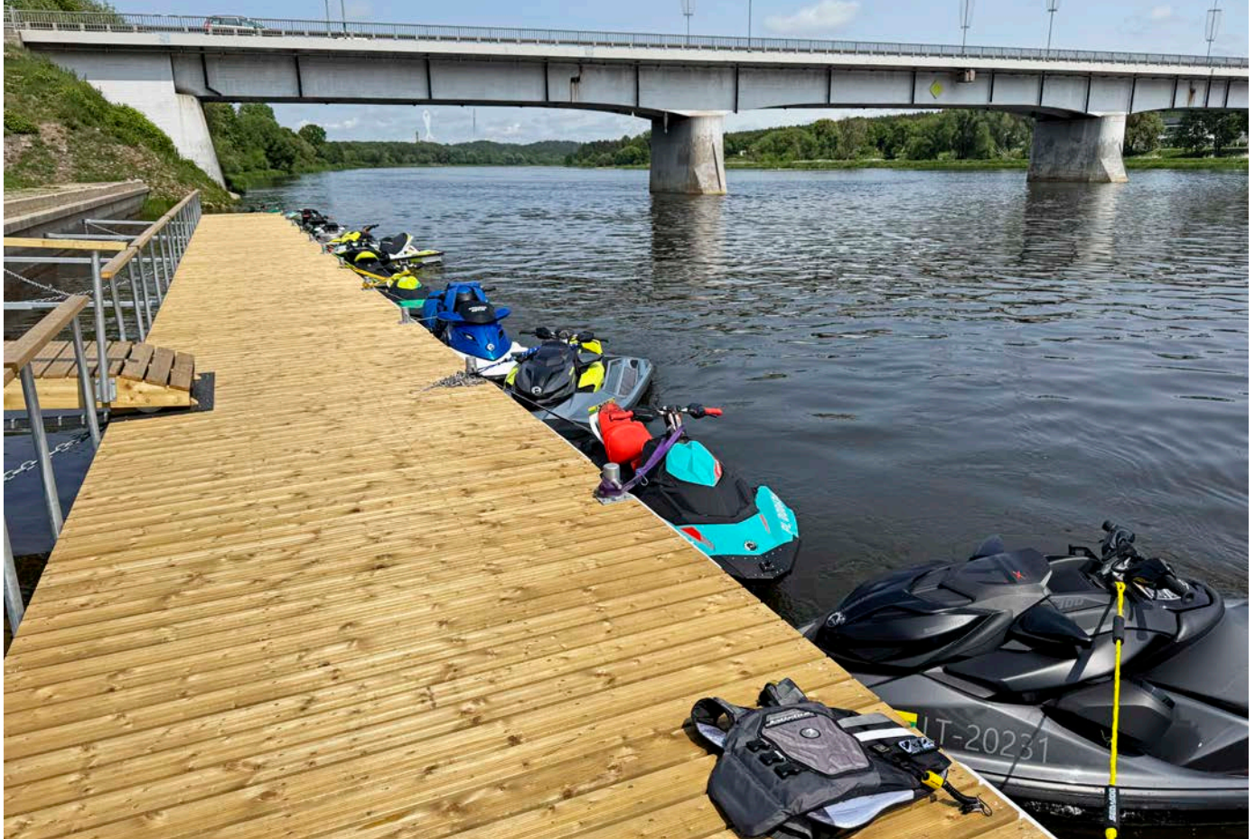
„Prienų rajonas turi išskirtinį gamtinį potencialą – Nemuno kilpas, miškus, ežerus ir patrauklias rekreacines teritorijas. Tai didelis mūsų krašto privalumas, kurį siekiame išnaudoti plėtodami turizmo ir rekreacijos infrastruktūrą“, – rajono išskirtinumą apibūdina meras.

europinių projektų įgyvendinimas. Savivaldybėje laikomės principo, kad jei jau tvarkome objektą, tai darome jį iš esmės – sutvarkome ne tik pastatą, bet ir aplinką, atnaujiname įrangą. Europos Sąjungos finansavimas dažniausiai padengia tik dalį projekto vertės, o likusią dalį tenka skirti iš savivaldybės biudžeto. Pavyzdžiui, lopšelio-darželio „Saulutė“ renovacijos projektui tikėjomės didesnės paramos, tačiau gavome kiek daugiau nei 220 tūkst. eurų, kai visa projekto vertė siekė apie 1,5 mln. eurų. Panaši situacija ir su „Tūkstantmečio mokyklų“ programa – investuojame gerokai daugiau nei gauname finansavimo. Tas pats ir su Prienų pirminės sveikatos priežiūros centro projektu – iš reikalingų beveik 2 mln. eurų gavome apie 1,2 mln. eurų paramos. Vis dėlto mūsų specialistai aktyviai teikė papildomas paraiškas, todėl pavyko gauti papildomą finansavimą pastato išorės renovacijai, kas sumažino savivaldybės finansinę naštą“.