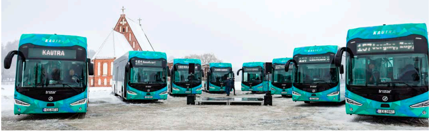
Kauno rajono savivaldybė žengia dar vieną svarbų žingsnį tvaraus viešojo transporto link. Vasario 12 d. prie Zapyškio Šv. Jono Krikštyto bažnyčios pristatyti 10 naujų „Irizar IE bus 12“ elektrinių autobusų, kurie kursuos rajono maršrutuose, jungiančiuose kurortines teritorijas. Autobusus įsigijo vežėjas UAB „Kautra“, kuris pagal sutartį teikia keleivių vežimo paslaugas savivaldybei.