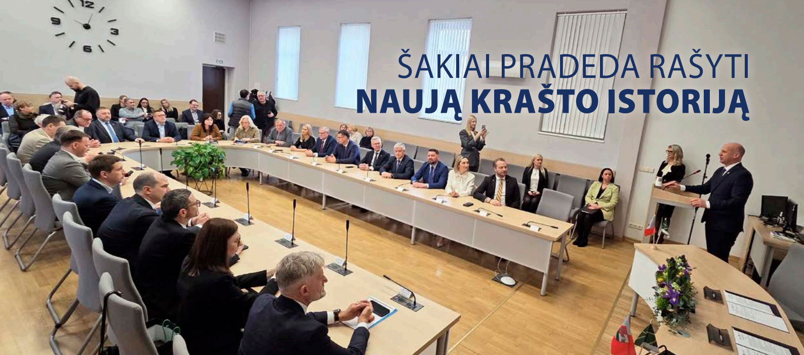
Šakių kraštui svarbios ceremonijos dalyviai: Seimo, Šakių ir Jurbarko savivaldybių, atsakingų ministerijų ir žiniasklaidos atstovai.