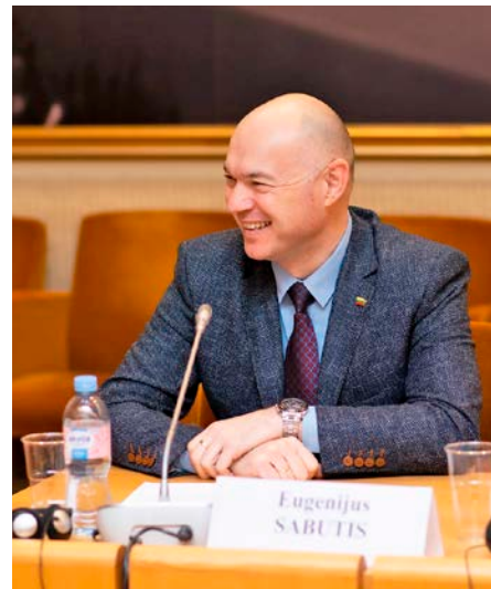
„Meras pavirsta tarsi ministru pirmininku“, – pastebėjo E. Sabutis.

Tarp reikšmingesnių pokyčių parlamentaras išskyrė merui suteiktą teisę pačiam formuoti savo komandą. „Meras galės apsispręsti ne tik dėl vicemerų, administracijos direktoriaus, bet kartu su taryba ir dėl didesnės mero politinės komandos, įvertinus poreikį, kokiose srityse savivalda turėtų pasitempti ir įdėti daugiau indėlio. Dabar nė vienas meras negalės sakyti, kad čia ne aš, o taryba man primetė ar paskyrė netinkamus komandos narius. Tačiau didesnė