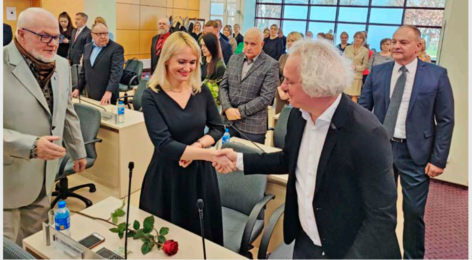
Tarybos narių sveikinimai tarybos nariams.

„Šimtai milijonų, skirtų 2020–2023 m. ES finansuojamiems projektams, bus prarasti, nes iki šiol dėl paramos nesuderinta daugybė teisės aktų, nors tai turėjo būti padaryta jau