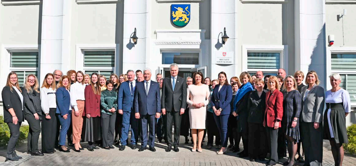
„Jūs, mielieji, esate tie, kurie kuriate, auginate miestą ir vedate jį į ateitį. Sveikinu jus su šia gražia švente“ – kalbėjo Lietuvos Prezidentas Gitanas Nausėda (centre) susitikime su Rietavo savivaldybės tarybos nariais ir darbuotojais.