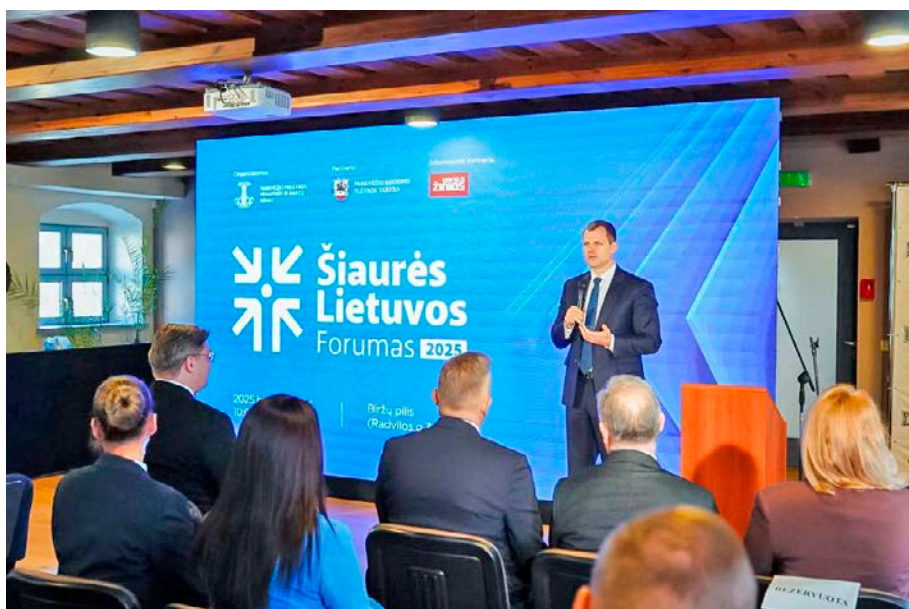
Forumo dalyvius pasveikino Ministras Pirmininkas Gintautas Paluckas, pažymėdamas centrinės valdžios, savivaldos ir privataus sektoriaus bendradarbiavimą.