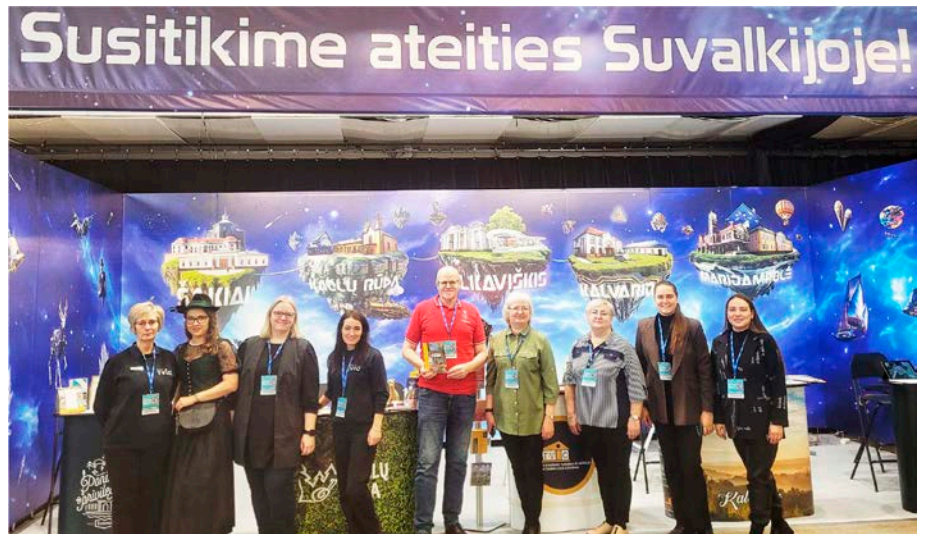
Sausio 25–28 dienomis Vilniuje vyko tradicinė tarptautinė aktyvaus laisvalaikio ir turizmo paroda Adventur 2024, kurioje Kazlų Rūdos turizmo ir verslo informacijos centras dalyvavo kartu su kitais Suvalkijos apskrityje dirbančiais turizmo informacijos centrais: Vilkaviškio, Marijampolės, Šakių ir Kalvarijos.