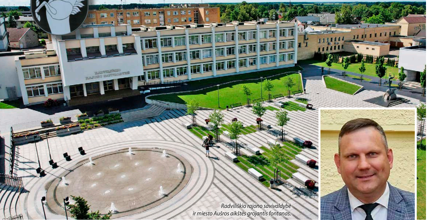
Radviliškio rajono savivaldybė ir miesto Aušros aikštės grojantis fontanas.