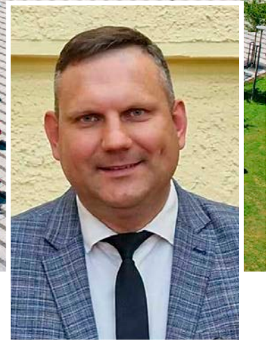
Kazimieras RAČKAUSKIS Radviliškio rajono savivaldybės meras