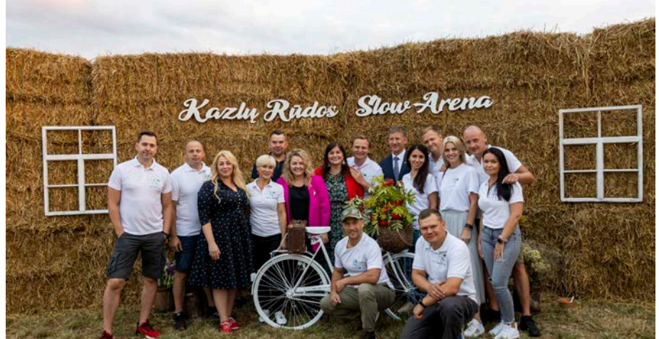
Kazlų Rūdos SLOW ARENA sugrįžta! Pernai neįtikėtino populiarumo sulaukęs renginių ciklas vėl džiugins rugpjūčio mėnesį. Arena įrengta Pinciškių kaime, netoli Via Baltica automagistralės, Kazlų Rūdos savivaldybėje.