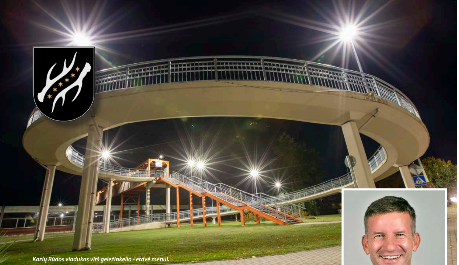
Kazlų Rūdos viadukas virš geležinkelio - erdvė menai.