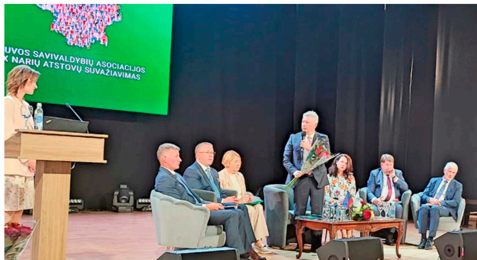
Suvažiavimo dalyvius nuotoliniu būdu sveikino Lietuvos prezidentas Gitanas Nausėda ir gyvai – Seimo pirmininkė Viktorija Čmilytė-Nielsen (kairėje).

Gegužės 23 d. Raudondvaryje (Kauno r.) vykusiame Lietuvos savivaldybių asociacijos (LSA) suvažiavime šalies savivaldybėms atstovaujantys vietos savivaldos politikai patvirtino strateginius savivaldos siūlymus šalies politinėms partijoms, kurios rudenį ketina dalyvauti Seimo rinkimuose.