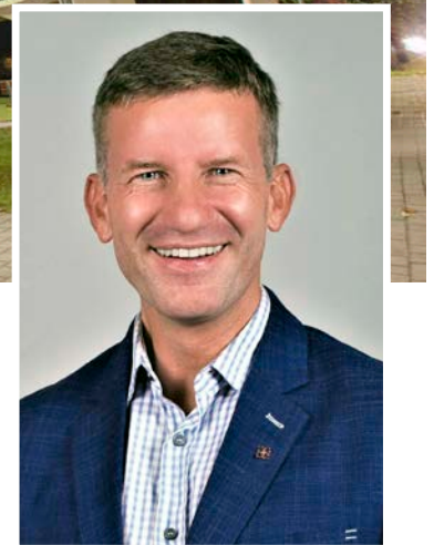
Mantas VARAŠKA Kazlų Rūdos savivaldybės meras