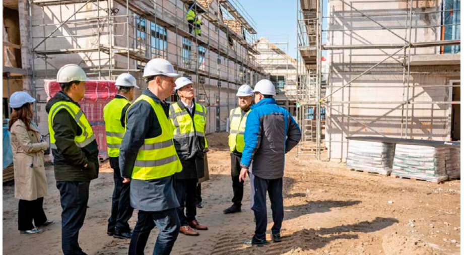
Melnragėje kuriasi nauji senyvo amžiaus žmonių globos namai. Ši vieta taps jaukiu prieglobsčiu 81 senjorui.

Vos pradėję dirbti kalbėjome apie labai sparčią mokyklų renovaciją. Tiesa, siekiai buvo didesni, tačiau susidūrėme su realybe, kad nėra kur perkelti vaikų, kol jų mokyklose vyksta statybos darbai. Procesas vyksta, tačiau vienu metu kompleksškai tvarkyti didesnio kiekio mokyklų neįmanoma būtent dėl fizinių patalpų trūkumo. Visgi galime pasidžiaugti, kad darbai jau baigti Hermano Zudermano gimnazijoje, o šiuo metu tvarkome Ažuolyno