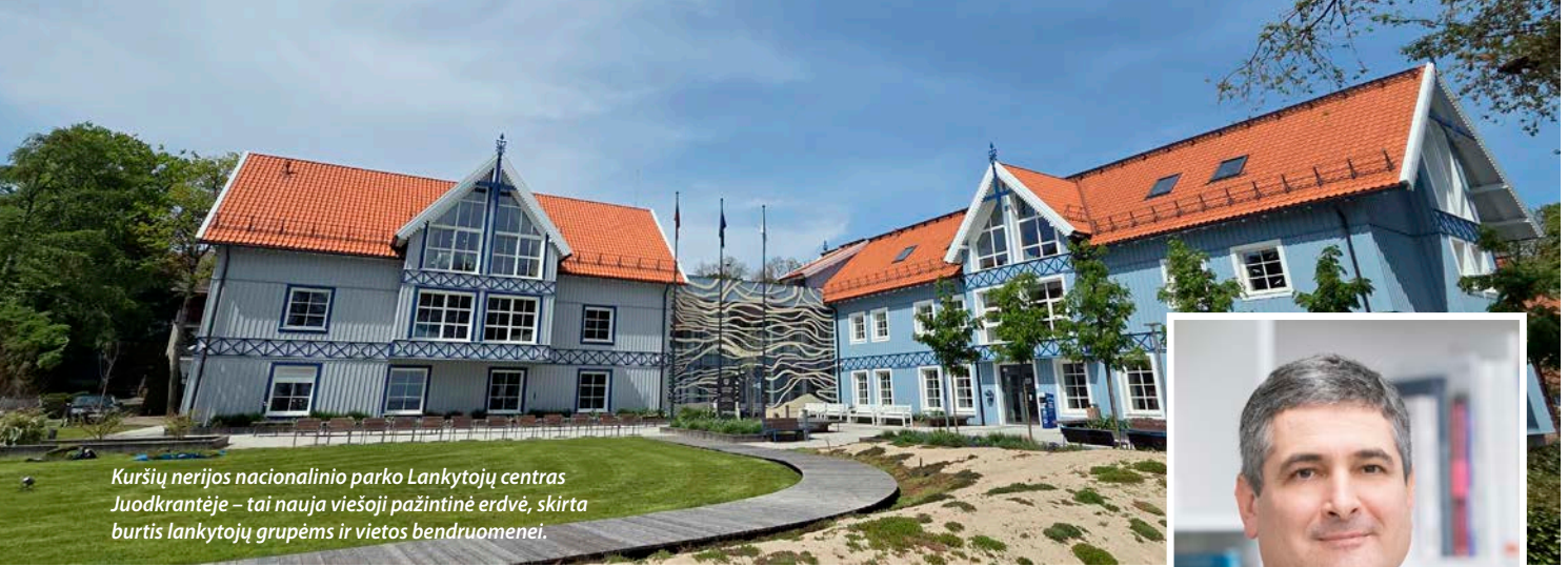
Kuršių nerijos nacionalinio parko Lankytojų centras Juodkrantėje – tai nauja viešoji pažintinė erdvė, skirta burtis lankytojų grupėms ir vietos bendruomenei.