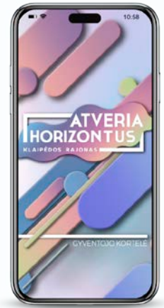
Klaipėdos rajono gyventojų kortelė.

eurų daugiau nei 2024 m. Išlaidos ekonomikai augo beveik 5 mln. eurų. Socialinei apsaugai taip pat skyrėme beveik 2 mln. eurų daugiau nei 2024 m.