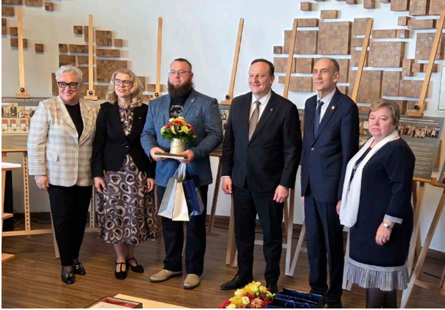
Nominacijos „Vietos infrastruktūrą gerinanti vietos bendruomenė“ nugalėtoja tapo Gataučių bendruomenė (Joniškio r.).