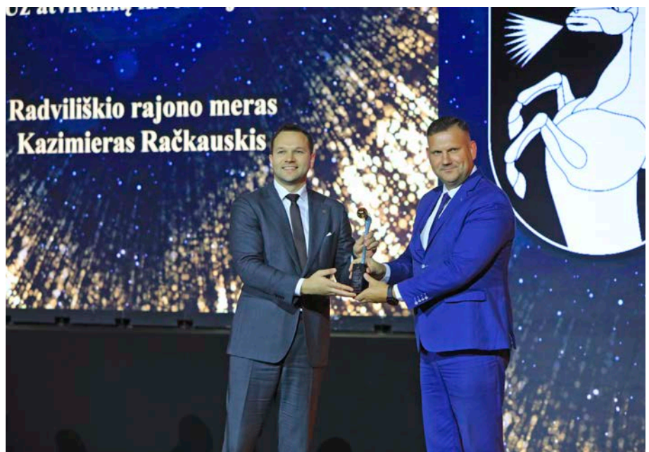
Savivaldybei skirta „Aukšinė krivulė“ už atvirumą investicijoms.

Baisogaloje, Pakiršinyje, Vainiūnuose ir Ilguočiuose – čia pradėti eksploatuoti nauji filtrai. Taip pat modernizuojamos vandenvietės Skėmiuose, Pociūnėliuose, Pašušvyje, Vaitiekūnuose ir Kairėnuose, diegiant automatizavimo sprendimus.