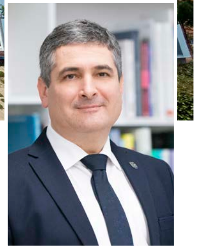
Darius JASAITIS Neringos savivaldybės meras