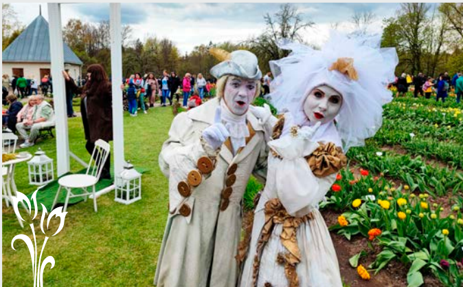
Svečius pasitiko Kauno mimai.