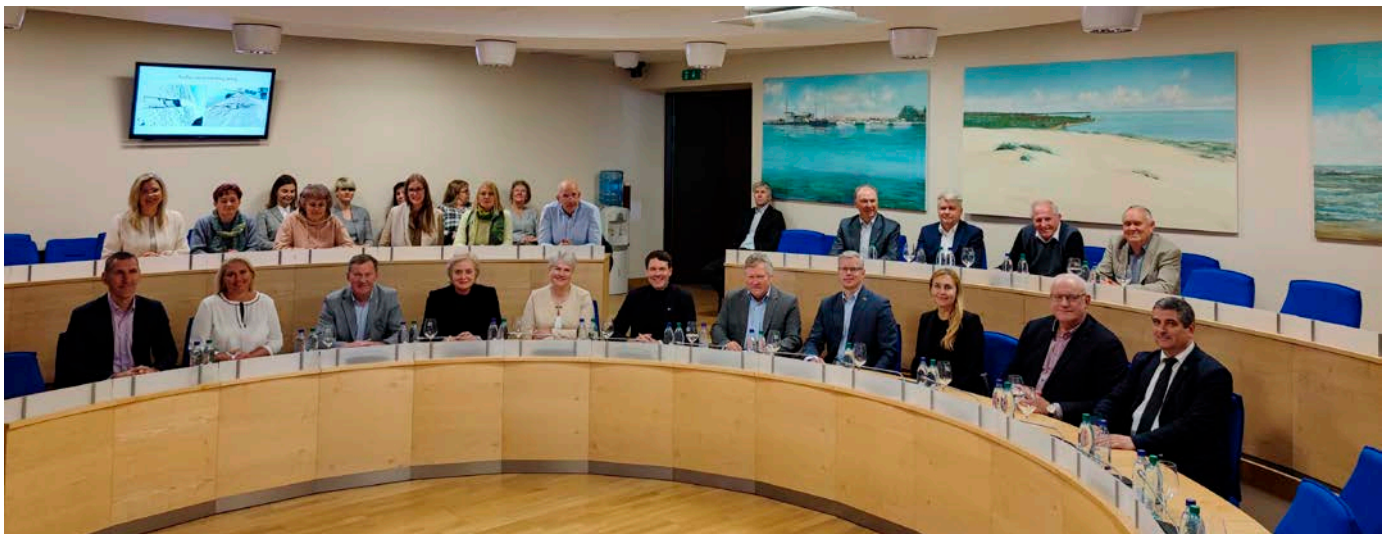
Neringos savivaldybėje susitiko Seimo Ekonomikos komiteto delegacija, Neringos ir Birštono savivaldybių tarybos nariai. Posėdžio metu mintimis ir pasiūlymais dalijosi Neringos savivaldybininkai.

Poilsiu labai svarbi ir kultūrinė aplinka. Praėję metai, kai Neringa buvo Lietuvos kultūros sostinė, pateikė labai daug malonių akimirų. Tad kokie renginiai kvies į Neringą šiais metais ir ar pavyks išsaugoti aukštai užkeltą kultūros kartelę?