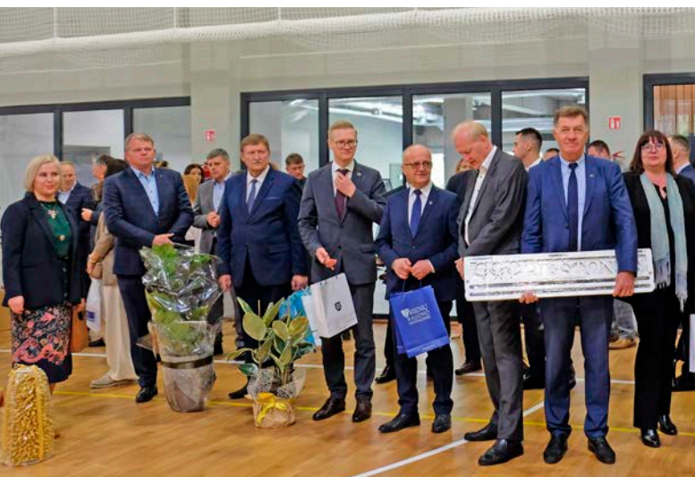
Atidarymo renginyje su dovanomis dalyvavo gretimų savivaldybių merai ir Seimo nariai.

Taigi, kviečiame pasisvečiuoti Birštone. Birželio 9–12 d. vyks miesto šventė.