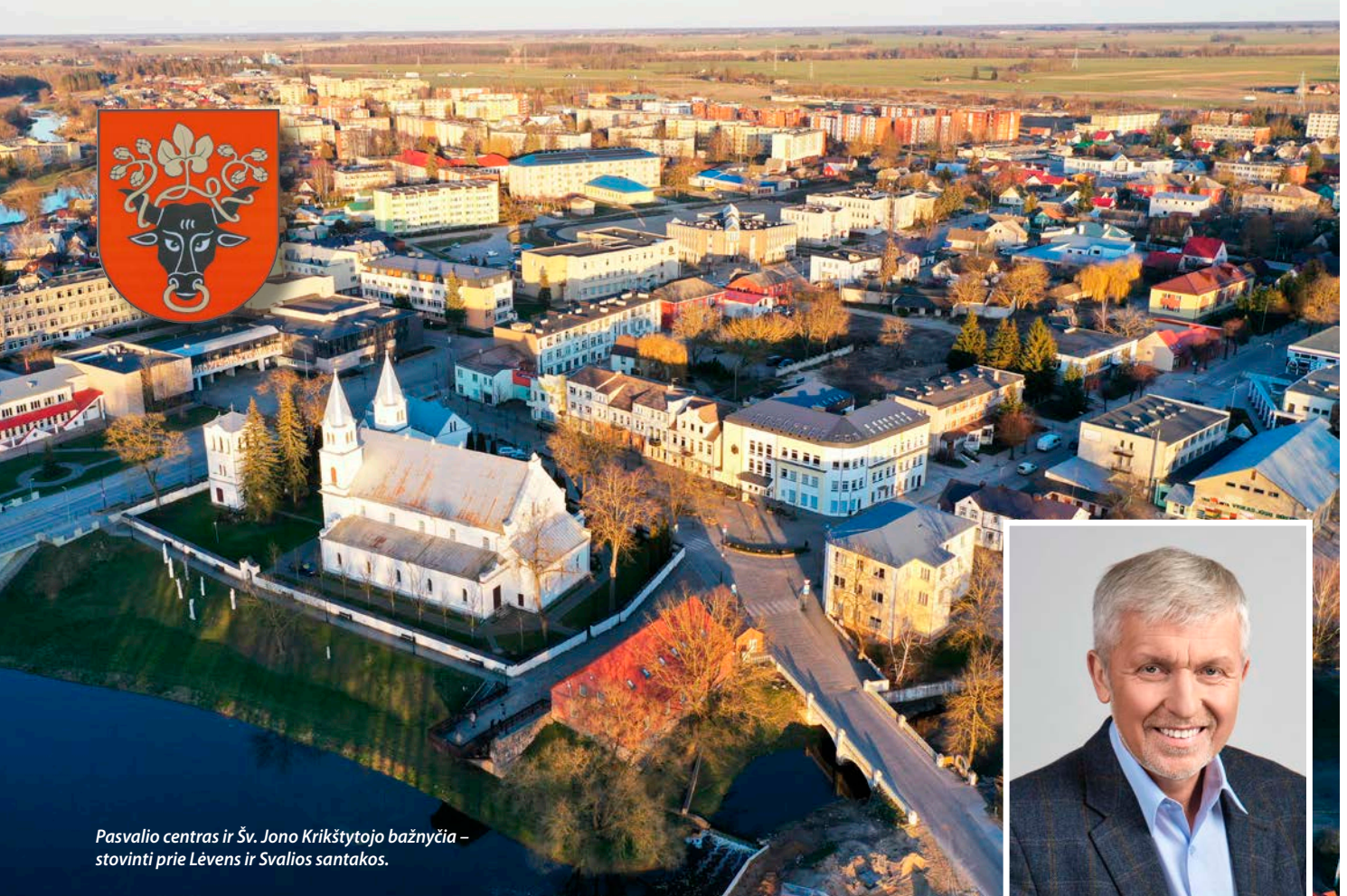
Pasvalio centras ir Šv. Jono Krikštytojo bažnyčia – stovinti prie Lėvens ir Svalios santakos.