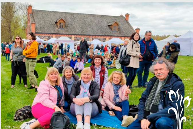
Varėnos mokytojų delegacija liko patenkinta tulpių žydėjimu ir šventės renginiais.