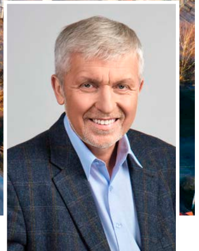
Gintautas GEGUŽINSKAS Pasvalio rajono meras