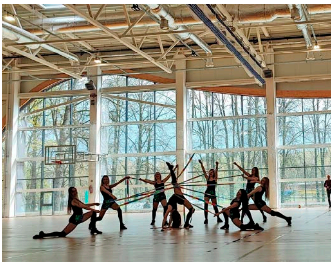
Dalyviams prisistatė šokėjos iš Kauno.