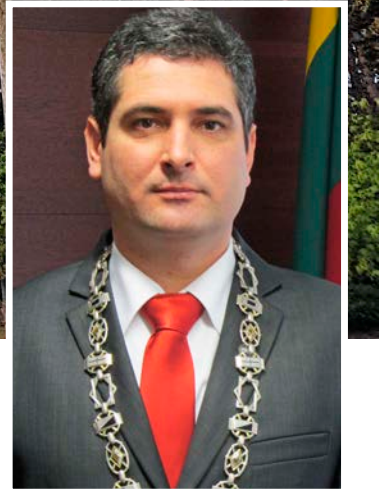
Darius JASAITIS Neringos savivaldybės meras